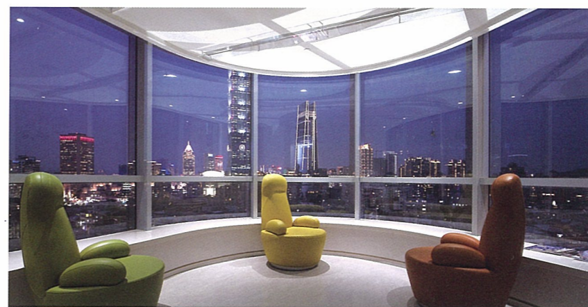
1 2 3 4 1. 聲音之廳。 2. 畫之廊 / 抽血櫃檯。 3. 舞之廊。 4. 等候空間。

而「沒有藝術品的藝廊，唯一的藝術品就是人」的概念是個實驗案例，期望以醫院的標準建材能營造「空間質感」的氛圍，讓這個處理手法能延續到以治療為主軸的醫院內其他空間，使病人除了得到醫療專業的協助外，也能從空間中獲得一絲心靈的慰藉，達到真正「以病人為中心」的目標。